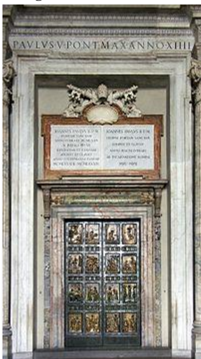
Puerta Santa de San Pedro.

Este jubileo comenzó con la apertura de la Puerta Santa en la Basílica de San Pedro durante la Solemnidad de la Inmaculada Concepción el 8 de diciembre de 2015. 9 Sin embargo no fue la primera Puerta Santa, que Francisco abrió con motivo del año de la misericordia, en su visita pastoral a la República Centroafricana, el día 29 de noviembre, 9 días antes del comienzo oficial, abrió la Puerta Santa de la Catedral de Nuestra Señora en la capital Bangui. Fue la primera Puerta Santa abierta por un Papa, fuera de Roma. 10